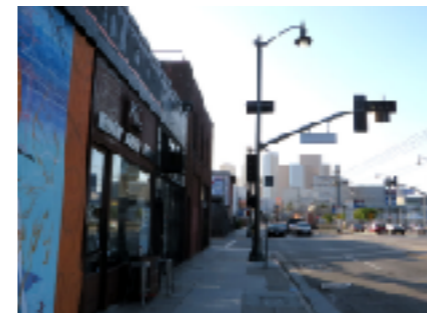
アカデミーからロスのダウンタウンを望む

●KCビューティー アカデミーへの問い合わせ先 KC Stylist Academy Japan Phone: 050-3601-4932 Web: http://www.kcstylist.jp/ Email: kcjapan@kcstylist.jp