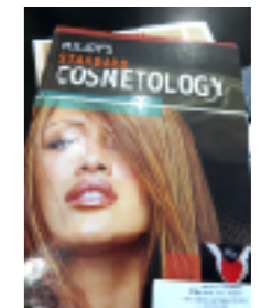
化粧品化学の教科書