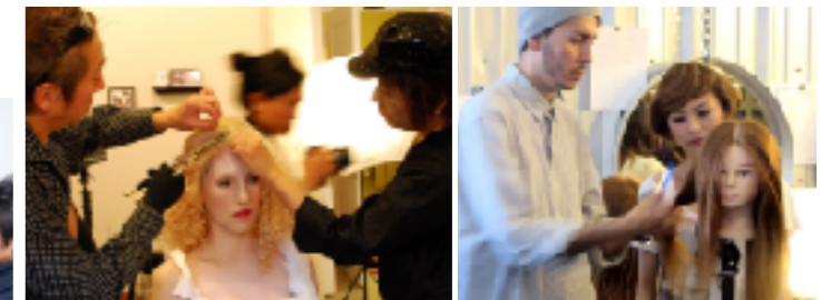
トップスタイリストからの指導