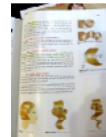
美容理論の教科書